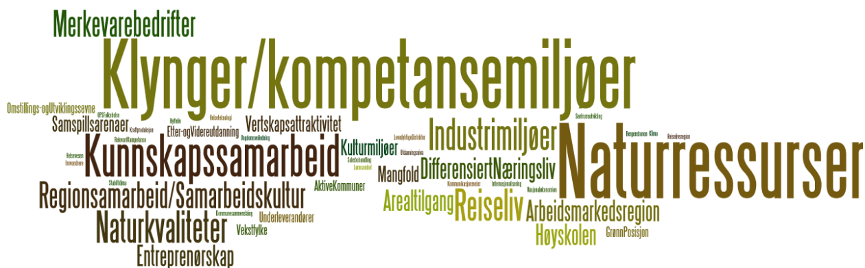
FIGUR 3.2 Fortrinn og muligheter

At Buskerud har et differensiert næringsliv er også trukket fram som positivt. For ensidig næringsstruktur kan medføre store utfordringer – hvis omstendigheter tvinger fram forandringer eller nedleggelse..