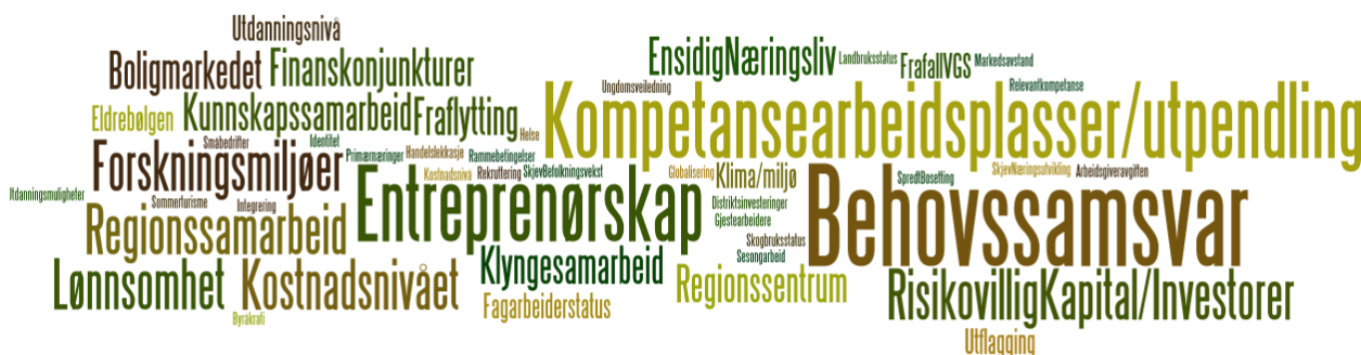
FIGUR 3.1 Utfordringer for Buskerud fylke

Det er viktig å understreke innledningsvis at infrastruktur og samferdsel oftest ble framhevet som tema som omhandlet avgjørende utfordringer for næringslivet. Infrastruktur og samferdsel er utelatt i ordskyen nedenfor, rett og slett fordi dette ville medføre at de øvrige ordene ville blitt for små til å visualisere innbyrdes forskjeller mellom disse. At