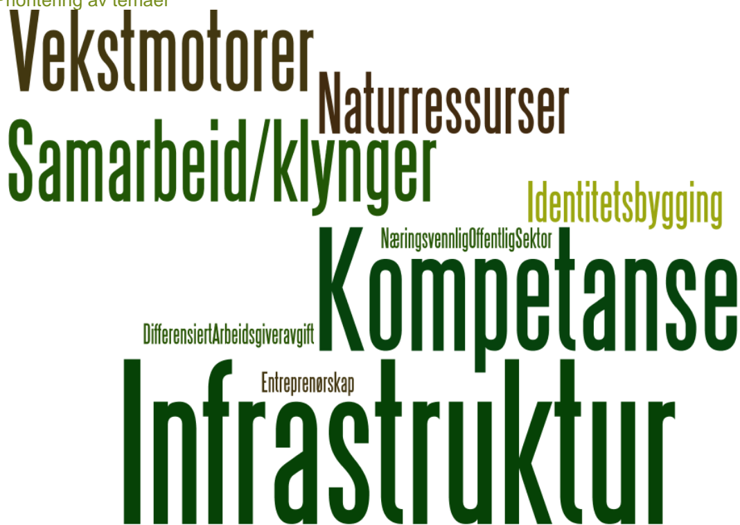
FIGUR 4.1 Prioritering av temaer

Når det gjelder temaet samarbeid , dreier dette seg både om trippel-helix, altså samarbeid mellom næringsliv – utdanningsinstitusjoner/ forskningsmiljøer og det offentlige, men også regionsamarbeid.